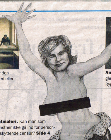
ILLUSTRATION: MARCOS BYRD + CENCUR

Patmaleri. Kan man som kunstner ikke gå ind for personbeskyttende censur? Side 4