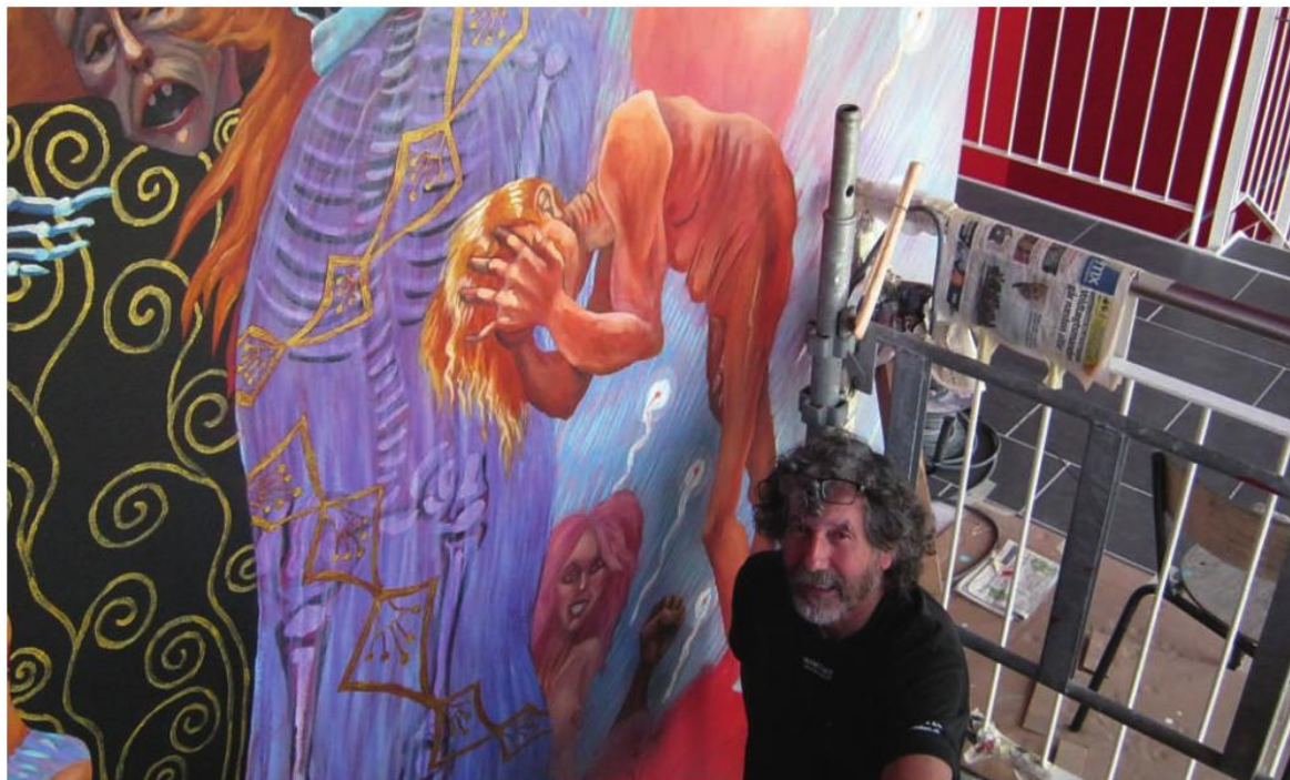
Marcos i gang med Køge Privat Real Gymnasium foyer i Olby 8 x 4 mtr.

- Modsat mange, der kalder sig multikunstnere, excellerede PH i alle discipliner. Hans motto var "Rend mig i den offentlige