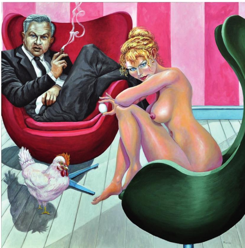
"THE EGG CAME FIRST" 120 x 120 cm - Acryl på lærred

mening", selv om han egentlig havde en humanistisk grundindstilling. Hans PH-lamper, der ligner tre flyvende tallerkener, oplyste første gang aftenene i 1926 og hænger i dag over hele verden som originaler eller kopier, og han udviklede flere avancerede modeller over samme tema.